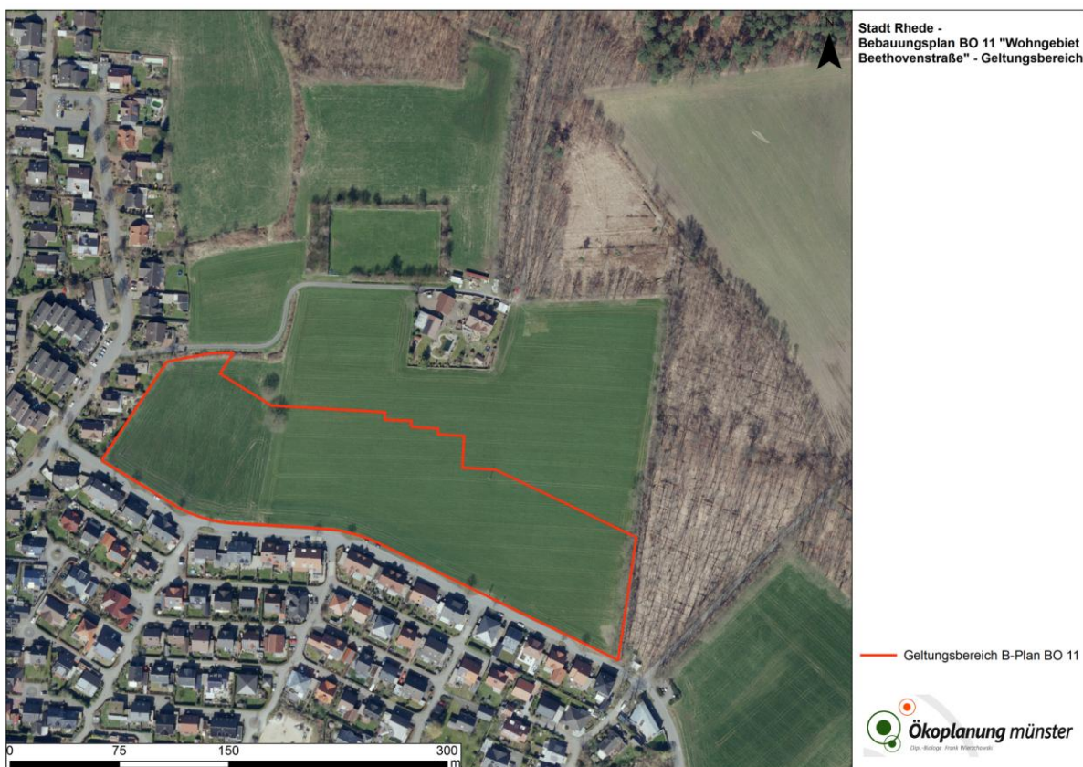
Abbildung 1: Luftbild und Geltungsbereich des Bebauungsplanes BO 11 „Wohngebiet Beethovenstraße“ der Stadt Rhede.

Das Kommunalunternehmen Flächenentwicklung Rhede plant die Aufstellung des Bebauungsplanes BO 11 „Wohngebiet Beethovenstraße“ der Stadt Rhede. Vorgesehen ist die Entwicklung eines Wohnbaugebietes nördlich der Beethovenstraße auf bisher als Acker und Grünland genutzten landwirtschaftlichen Flächen. Der Bebauungsplan umfasst nach derzeitiger Abgrenzung eine Größe von 3,1 ha. Abbildung 1 zeigt ein Luftbild des Plangebietes mit dem Geltungsbereich des Bebauungsplanvorhabens. Abbildung 2 zeigt einen Entwurf des Bebauungsplanes.