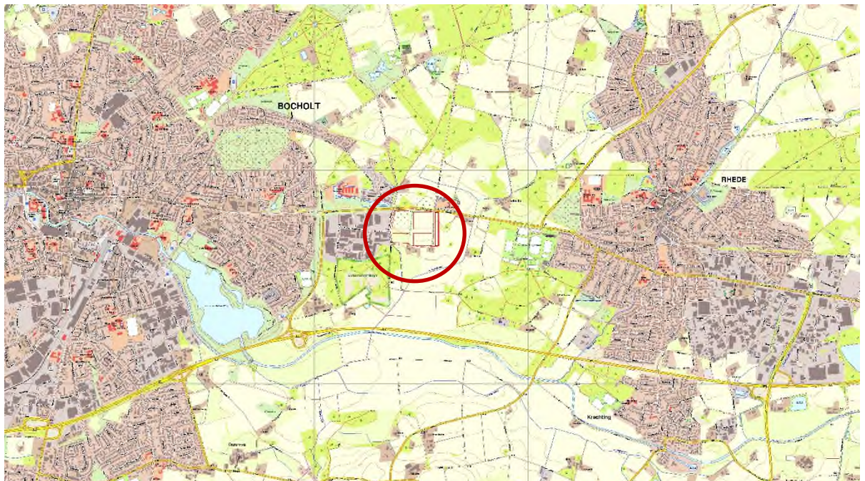
Abbildung 1: Übersichtskarte

Die folgende Verkehrsuntersuchung beschäftigt sich mit der verkehrlichen Leistungsfähigkeit des vorhandenen Knotenpunktes und schätzt auf Grundlage der geplanten Erschließung die zukünftigen Verkehre ab. Als Ergebnis der Verkehrsuntersuchung soll geprüft werden, ob die zukünftigen Verkehre leistungsfähig über den lichtsignalgeregelten Knotenpunkt abgewickelt werden können.