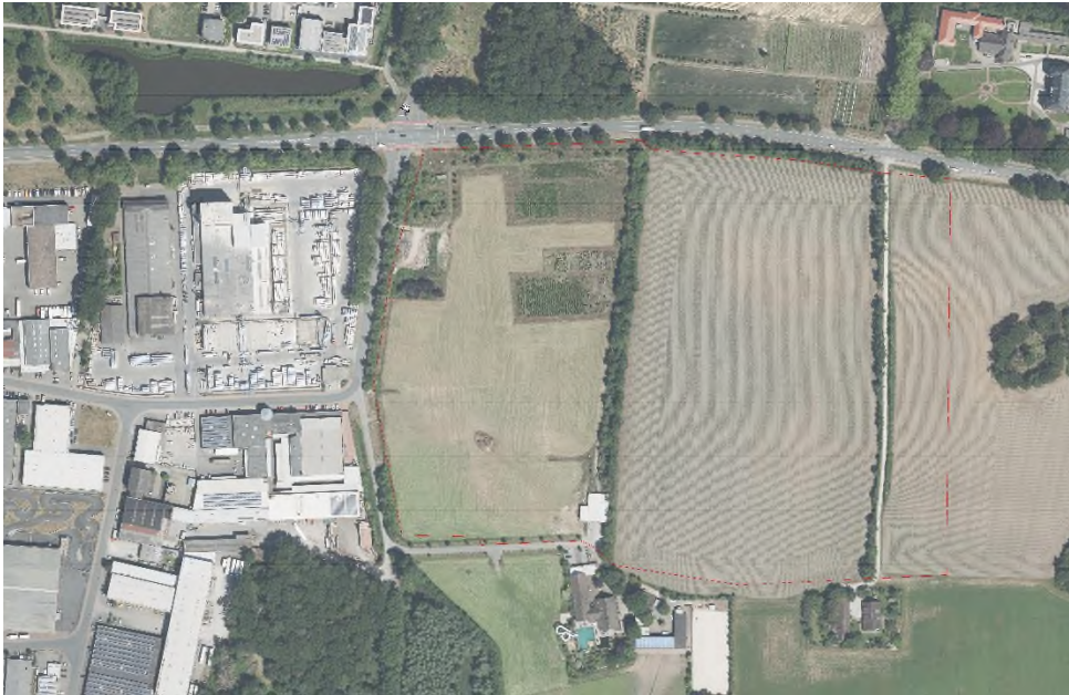
Abbildung 2: Luftbild des geplanten Gebietes

Die einmündenden Straßen In der Kickheide im Norden und Robert-Bosch-Straße im Süden dienen nahezu ausschließlich der Gewerbegebiets-Erschließung. Nur im weiteren Verlauf werden darüber einige wenige private Grundstück bzw. Höfe erschlossen.