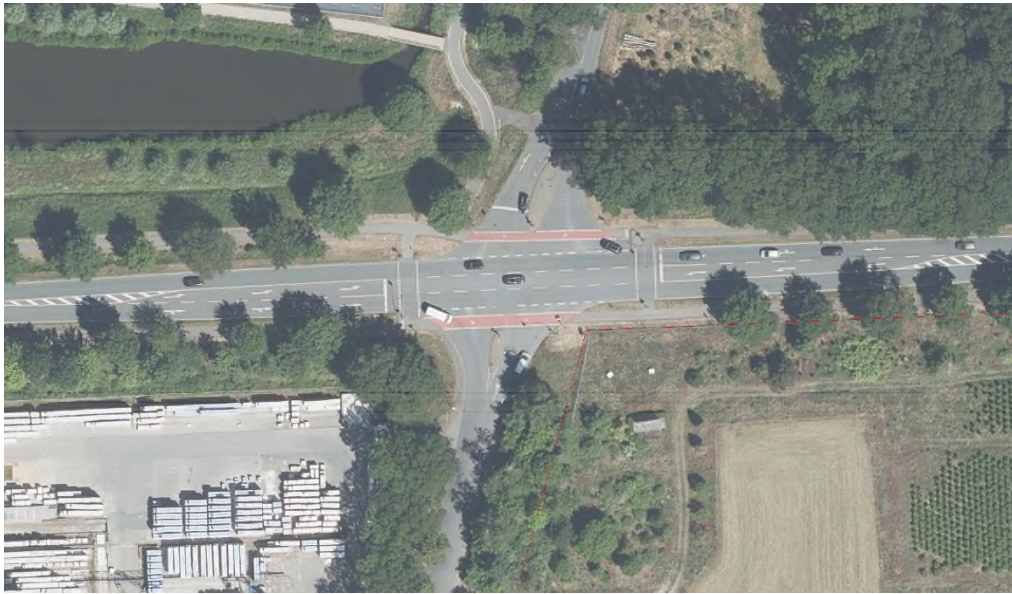
Abbildung 3: Luftbild des Bestandsknotenpunktes Bocholter Str./ Münsterstr./ Robert-Bosch Straße/ In der Kickheide