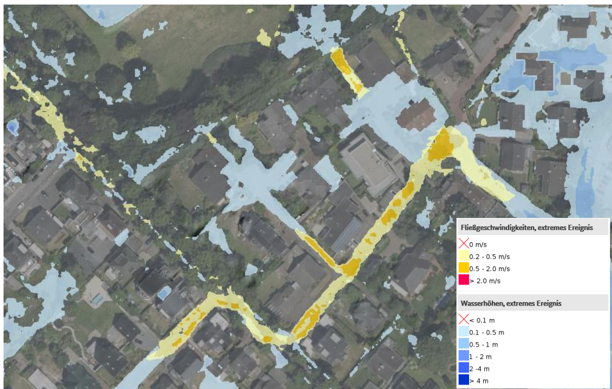
Abbildung 1: Seltenes Starkregenereignis (Kartendarstellung © Bundesamt für Kartographie und Geodäsie 2022 und Geobasisdaten © GeoBasis-DE / BKG 2022)

Im Oktober 2021 hat das Bundesamt für Kartographie und Geodäsie (BKG) eine interaktive Webkarte mit Gefahrenhinweisen zu Starkregen für das Gebiet Nordrhein-Westfalen veröffentlicht (Starkregengefahrenhinweiskarte NRW). Die Starkregengefahrenhinweise stellen die Ergebnisse der Simulation von Starkregenereignissen dar. Die Daten enthalten jeweils die maximalen Wasserstandshöhen und die maximalen Fließgeschwindigkeiten für ein seltenes (100-jährliches) und ein extremes Ereignis ( h_N = 90 \text{ mm/qm/h} ).