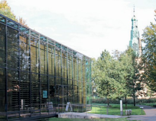
Du hättest gern mehr Infos? Im Naturparkhaus am Schloss Raesfeld laufen alle Fäden zusammen (RadRoute-Etappen 7, 8 und Q1).

Wo kannst du auf einer Radtour schon eine solche Vielfalt von Natur und Landschaftsformen erleben? Wie Bänder durchziehen sie unseren Naturpark: Im Süden, angrenzend an die Metropolregion Ruhr, die Folgelandschaft , zutiefst von den Folgen menschlichen Werkens geprägt. Dann entlang der Lippe eine vielgestaltige Wasserlandschaft mit Flüssen und Seen, darüber die Waldlandschaft mit viel Raum für Wildtiere, die die Zurückgezogenheit lieben. Und schließlich die Parklandschaft des Münsterlandes, darin eingebettet Restflecken der alten Bruch- und Heidelandschaft. Und all diese Vielfalt in erstaunlicher Nähe zum menschlichen Siedlungsraum: Hier kannst du im Stadtgebiet losradeln – ununterbrochen durchs Grün bis ins Naturschutzgebiet!