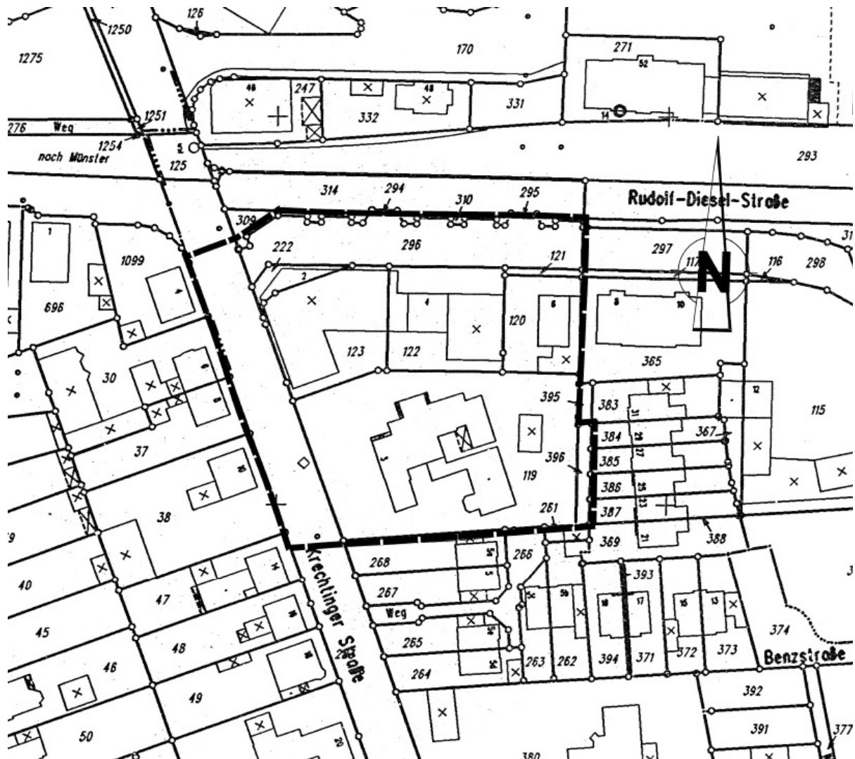
Abgrenzung des Bebauungsplangebietes ; Gemarkung Rhede, Flur 7 (Kartengrundlage: Kreis Borken, Rahmenkarte 4844.9 - Stand 10.08.2006)

Die Unterrichtung der Öffentlichkeit über die allgemeinen Ziele und Zwecke der Planungen, sich wesentlich unterscheidende Lösungen, die für die Neugestaltung oder Entwicklung in Betracht kommen, und die voraussichtlichen Auswirkungen der Planung erfolgt am