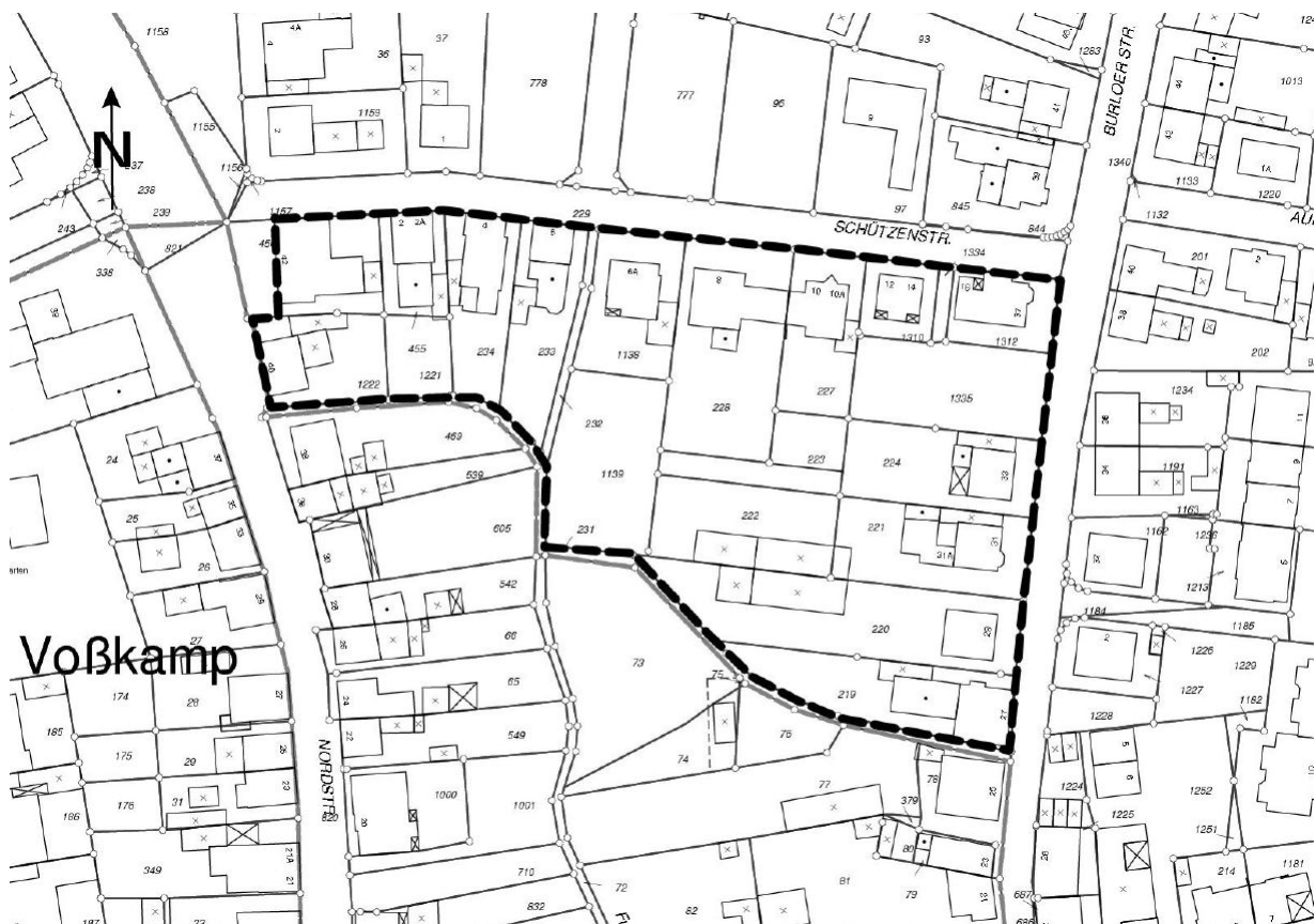
Abgrenzung des Änderungsbereiches, Gemarkung Rhede, Flur 9

Der Rat der Stadt Rhede hat in seiner Sitzung am 19.05.2010 gemäß §§ 2 ff. Baugesetzbuch die Aufstellung der 7. Änderung des Bebauungsplanes „Rhede B 1“ und zugleich die öffentliche Auslegung des Entwurfes der 7. Änderung des Bebauungsplanes „Rhede B 1“ (Bereich südlich der Schützenstraße, westlich der Burloer Straße und östlich der Nordstraße in Rhede) bestehend aus der Planzeichnung, den textlichen Festsetzungen und der Begründung beschlossen. Im Zuge der Änderung soll das zulässige Maß der baulichen Nutzung wie folgt angehoben werden: GRZ (Grundflächenzahl) 0,3 wird auf GRZ 0,4 angehoben, GFZ (Geschossflächenzahl) 0,5 wird auf GFZ 0,8 angehoben. Hierdurch wird eine bessere bauliche Ausnutzbarkeit der Grundstücke innerhalb der festgesetzten überbaubaren Flächen ermöglicht.